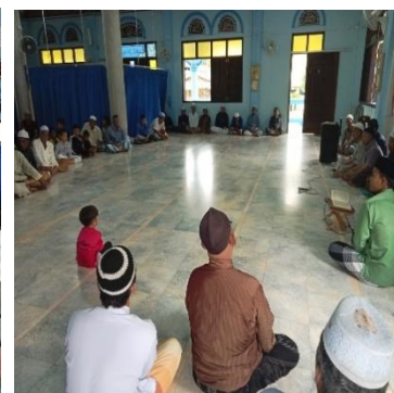
ผลสำเร็จของการจัดกิจกรรม ๔ ตุลาคม ๒๕๖๗