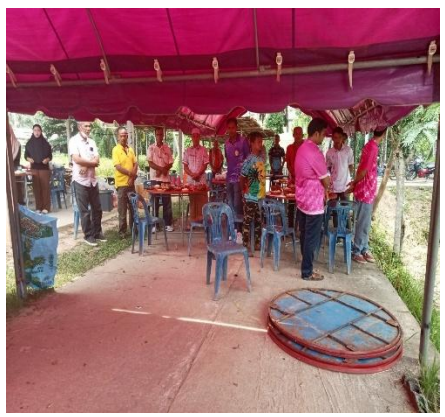
ผลสำเร็จของการจัดกิจกรรม วันที่ ๒๔, ๓๑ มกราคม ๒๕๖๘ และ วันที่ ๑๔, ๒๑ กุมภาพันธ์ ๒๕๖๘